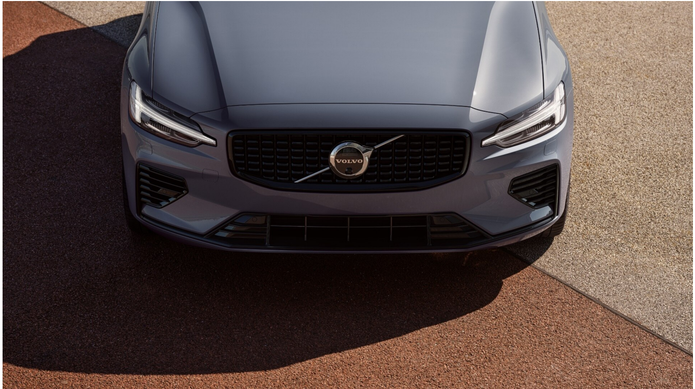
V60 Recharge Dark Exteriér

Pomocí tohoto kódu můžete svůj návrh sdílet s prodejcem Volvo